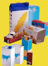
Briques et cartonnettes