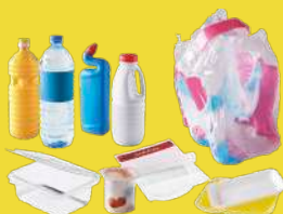
Emballages en plastique